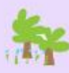
13 Jansens Park